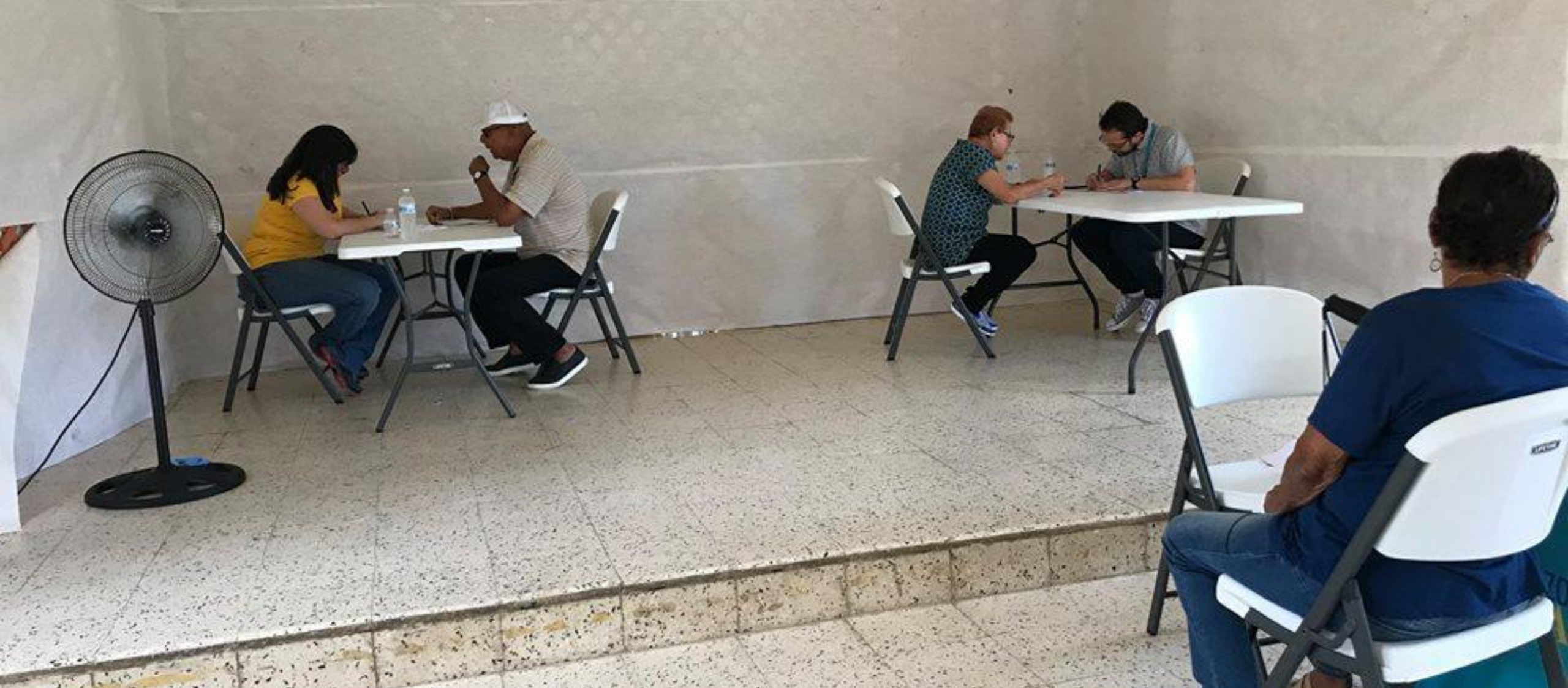
Orientando legalmente a los adultos mayores en Patillas, Puerto Rico