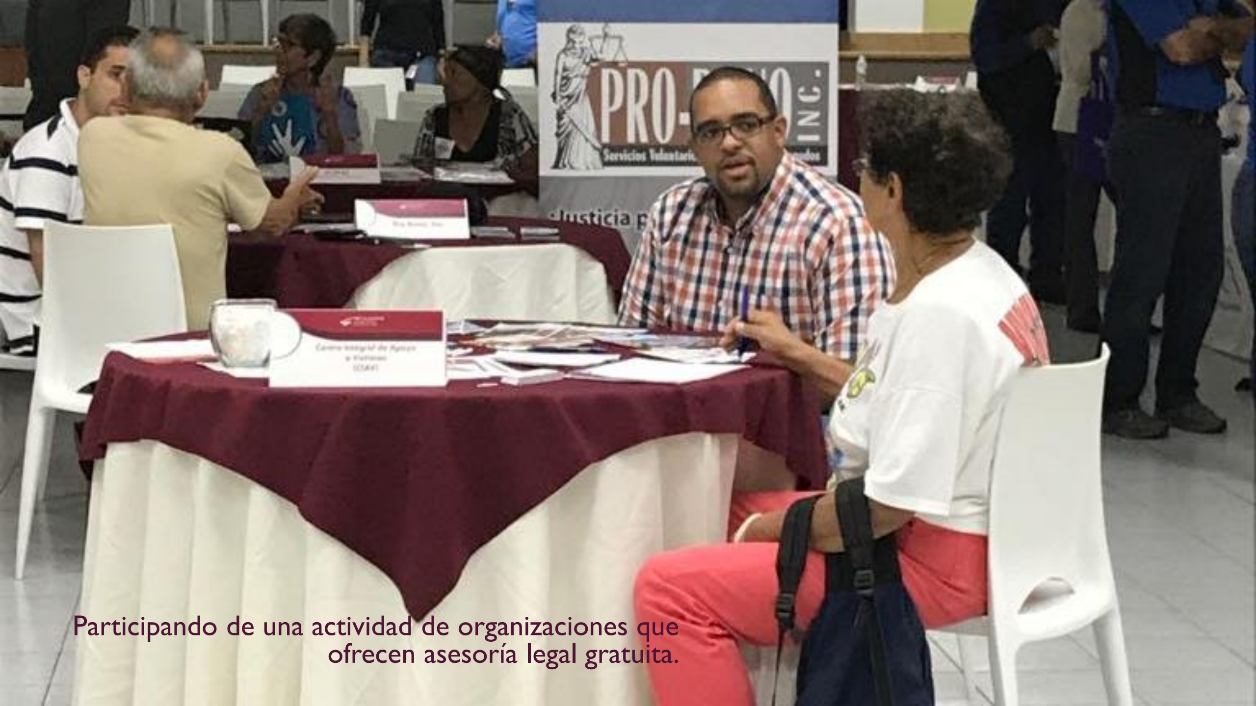
Participando de una actividad de organizaciones que ofrecen asesoría legal gratuita.